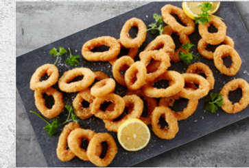
Blæksprutteringe Indbagte 4 x 2 kg Varenr. 6005