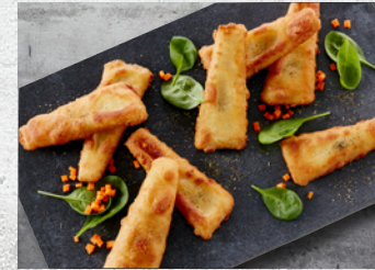
Sej Filet Indbagte Forstegte 55 g – 4 kg Varenr. 3533

Vi har lavet forarbejdet, så du kan bruge tiden på noget andet. Og du går ikke på kompromis med din faglige stolthed, for vores store sortiment af convenience-produkter bygger på fisk, der indfryses umiddelbart efter fangsten. Friskhed og konsistens bevares. Herefter har vi vendt produkterne i dej eller en nænsom panering, hvorefter nogle forsteges, før de indfryses. Hvis du skal servere for mange, får du et lækkert, saftigt resultat, når du tilbereder i ovn. Friturestegning er velegnet til fast food og to go-menuer.