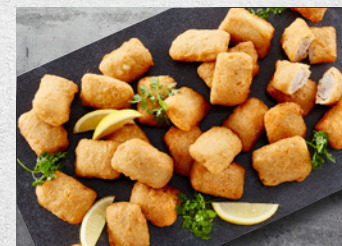
Kulmule Nuggets Forstegte 25-45 g – 2,5 kg Varenr. 3539