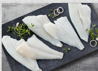
Alaska Ising Filet 60-80 g – 5 kg Varenr. 6435