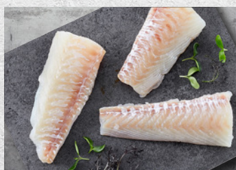
Kullerloins 80-100 g – 5 kg Varenr. 1193