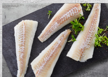
Torskehale- portioner 140-160 g – 5 kg Varenr. 1105