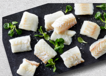
Torskeportioner 60-80 g – 5 kg Varenr. 1103 70-90 g – 5 kg Varenr. 1104