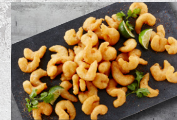
Kæmperejer 30/50 – Indbagte 10 x 1 kg Varenr. 5300