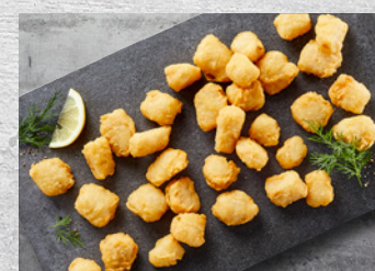
Alaska Sej Bites Indbagte Forstegte 10-20 g – 5 x 1 kg Varenr. 3537