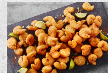
Kæmperejer med hvidløg 30/50 – Indbagte 10 x 1 kg Varenr. 5315