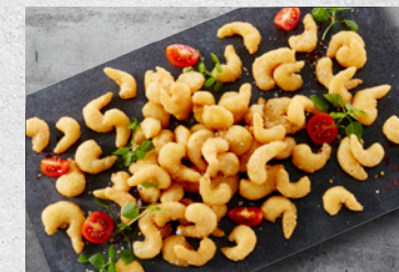
Rejer 90/120 – Indbagte 10 x 1 kg Varenr. 5310