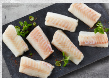
Torskeloins 100-120 g – 5 kg Varenr. 1066 120-140 g – 5 kg Varenr. 1092 140-160 g – 5 kg Varenr. 1094

Til dig, der selv vil sætte smag på dine paneringer. Straks efter fangsten indfryses fiskene, så vi sikrer, at de bevarer deres friskhed, vitaminer, konsistens og kødets struktur efter optøning. Fiskene opskæres i ensartede størrelser uden skind og ben – der er minimalt spild. De fleste af vores torsk fanges i Atlanterhavet, hvor fiskene vokser langsomt i det kolde vand, hvilket giver fiskene en fastere konsistens.