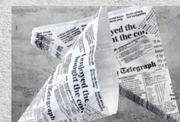
Kræmmerhuse Til Fish'N'Chips 500 stk. Varenr. 9902