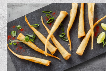
Reje Twister Ca. 25 g 6 x 800 g Varenr. 6297