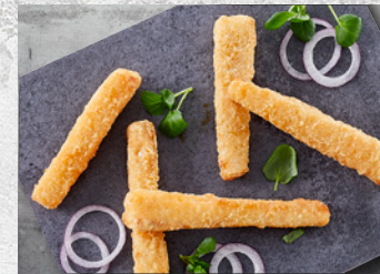
Torske Goujons I tempura Forstegte Ca. 25 g – 2,5 kg Varenr. 2815