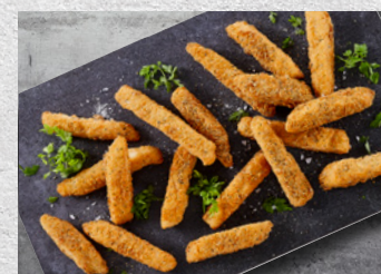
Ising Goujons Forstegte 15-35 g – 2,5 kg Varenr. 2811