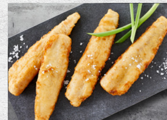
Alaska Sej Filet I tempura Forstegte 100-130 g – 2,5 kg Varenr. 3535